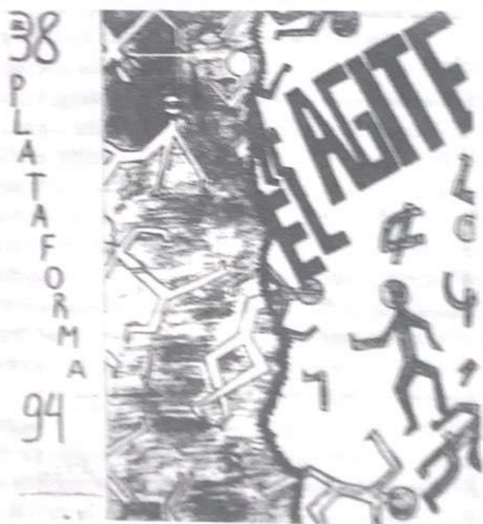
Figura 5: Boletín estudiantil El Agite, Colegio Nacional Tomás Guido, San Martín, Provincia de Buenos Aires.