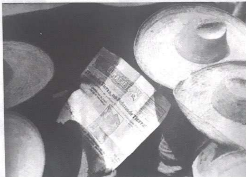
Figura 3: Hombres leyendo El Machete , Tina Modotti, 1924.

nas arqueológicas, monumentos coloniales y algunas imágenes del exotismo indígena) para retratar las manos de las personas que trabajan y exponer la crítica al monopolio informativo de las empresas y del gobierno cuando nos ofrece la imagen de unos campesinos leyendo los titulares del periódico El Machete . El titular expresaba una demanda clara en su época "¡Toda la tierra, no pedazos de tierra!" (Figura 3).