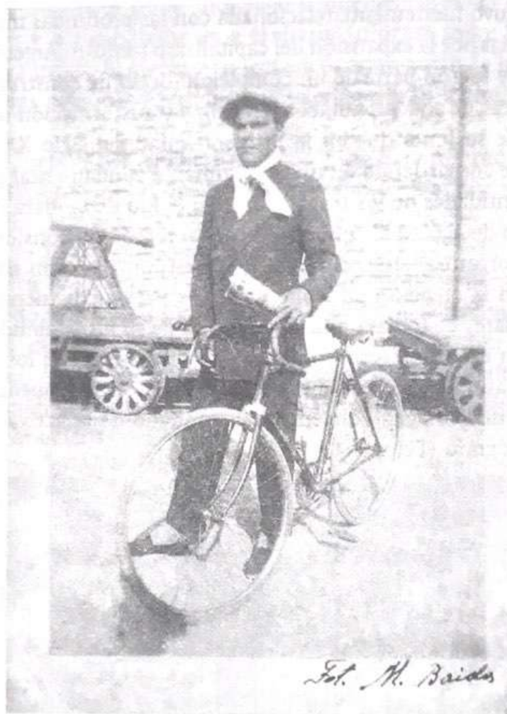
Figura 2: Obrero ferroviario, Buenos Aires, circa 1930, (gentileza de la familia Zabiuk, Berisso, Provincia de Buenos Aires).

Los obreros descubrieron el poder de la escritura, de la prensa y la difusión de ideas y algunos artistas realizaron sus intervenciones estéticas y políticas en estrecha vinculación con el mundo del trabajo y la experiencia de vida y las luchas de las clases populares. El análisis de algunos de esos vínculos se verá más adelante, ahora sólo quiero destacar dos experiencias que muestran los vínculos posibles entre artistas, prensa y mundo del trabajo. La primera fue realizada por Tina Modotti durante su estadía en el México de los años veinte. La fotógrafa rompió con las formas habituales de la representación del pintoresquismo mexicano (rui-