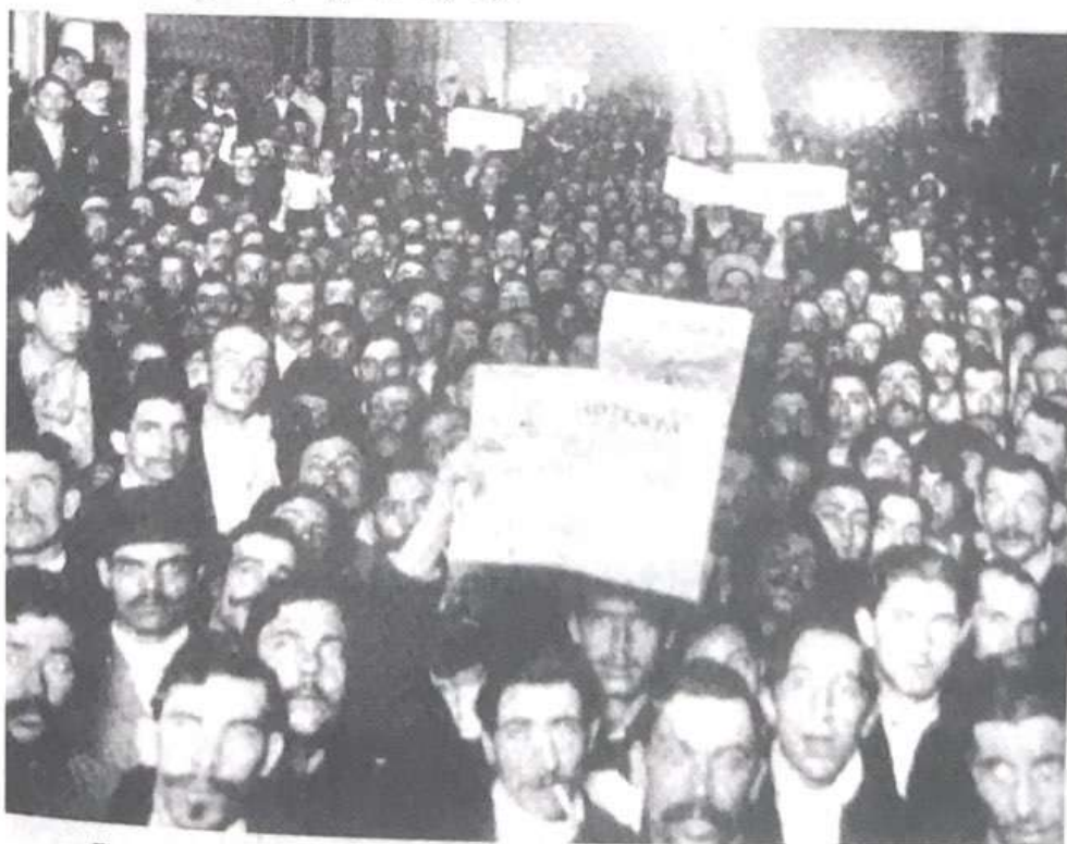
Figura 1: Obreros panaderos en el local de la calle Montes de Oca de la Ciudad de Buenos Aires muestran el diario anarquista La Protesta , 1914, AGN (Argentina).

Se puede sostener que en la primera mitad del siglo XX la prensa obrera se fue convirtiendo en una herramienta fundamental para construir las identidades de los trabajadores en el Río de la Plata. La lectura como medio de acceso al conocimiento y al placer era considerada crucial por las organizaciones obreras, que la estimularon con sus publicaciones y con la creación de bibliotecas. Los periódicos fueron para las clases populares de todo el mundo un signo de su respetabilidad y de su cultura y por eso numerosas fotografías los muestran con los diarios en sus manos, aunque es cierto que desde otra perspectiva puede interpretarse como una imagen convencional resultado de la activa participación del fotógrafo (Figuras 1 y 2).