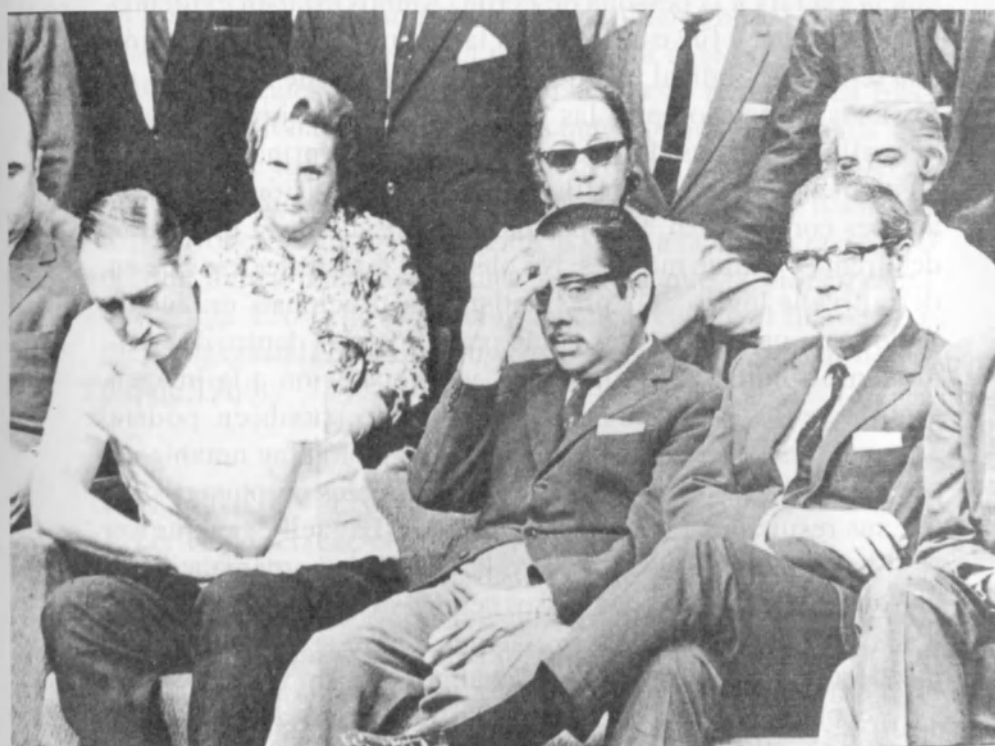
Augusto Vandor y a su lado Serú García durante el proceso electoral de Mendoza, 1965.

¿Qué podemos decir, entonces, de la imagen que Walsh tenía del vanderismo? Indudablemente, los sindicatos iban a ser territorio cada vez más hostil para los activistas de base que trataban de criticar y oponerse a la conducción gremial. El uso de matones y de la “barra” para intimidar y reprimir a potenciales adversarios era un hecho cotidiano de la vida del vanderismo. Pero no era ésta la única forma de exclusión practicada en los sindicatos. Aunque las mujeres tenían un peso creciente dentro de la fuerza laboral argentina, estaban virtualmente ausentes de los organismos directivos del movimiento sindical. Aun en sindicatos con una significativa concentración de trabajadoras, como los textiles, encontramos a muy pocas de ellas en los cuerpos representativos del gremio por