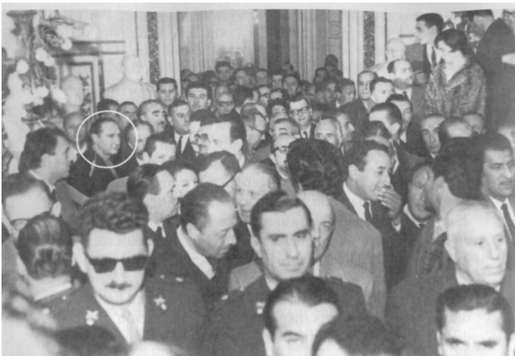
Asunción del general Juan Carlos Onganía. Entre la concurrencia, Augusto Vandor.

ridas por los problemas argentinos. Sus frecuentes contactos con muchas de las figuras que estaban detrás del golpe en los meses previos a su ejecución, junto con el peso de la presencia gremial en la sociedad argentina, parecían asegurarles un acceso privilegiado a las nuevas autoridades públicas. Según sus cálculos, un régimen militar también reduciría seriamente la capacidad de maniobra política de Perón y su ejercicio de la autoridad a expensas de la dirigencia sindical. Al cabo de un año, estos cálculos, aunque muy plausibles, se revelarían como ilusiones en su confrontación con un régimen extremadamente autoritario resuelto a lograr a cualquier precio la racionalización de la economía y la modernización del Estado (véase el capítulo II).